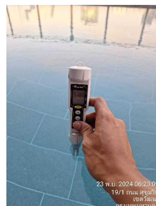
รูปที่ 3.5.3-2 การตรวจวัด pH, Cl_2 สระว่ายน้ำ