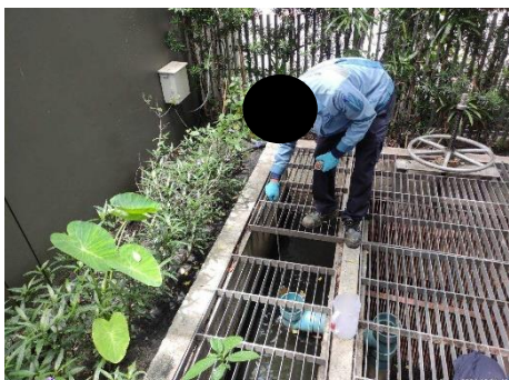
รูปที่ 3.5.5-1 การเก็บตัวอย่างน้ำของระบบบำบัดน้ำเสีย