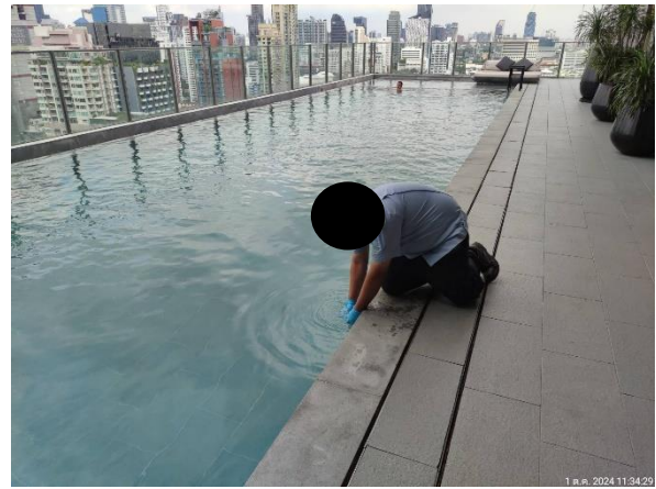
รูปที่ 3.5.3-1 การเก็บตัวอย่างน้ำบริเวณสระว่ายน้ำ